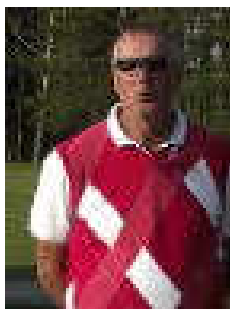
Börje Bäck Tabell Lista