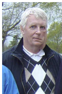
Jan Gustavsson Tabell Lista