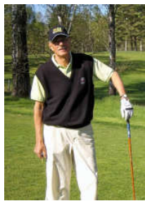
P-O i H65-1