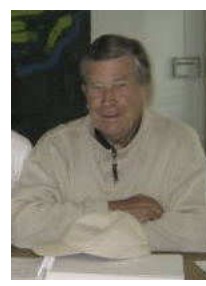
Hasse i H75

Läs mer under seriespel på resultatsidan .