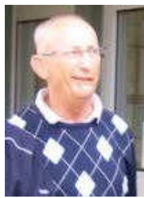
Wåge i H65-2